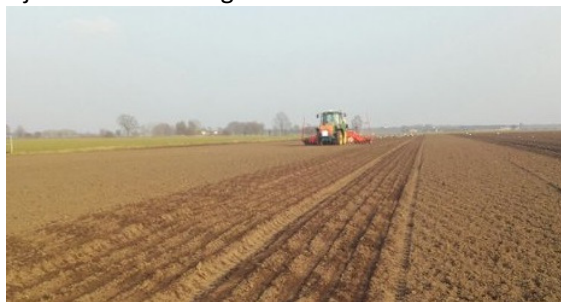
Afb. 1. Zaaïen van Barito

Hoe grillig het weer ook kan zijn, op 11 maart zijn de eerste uien gezaaid.